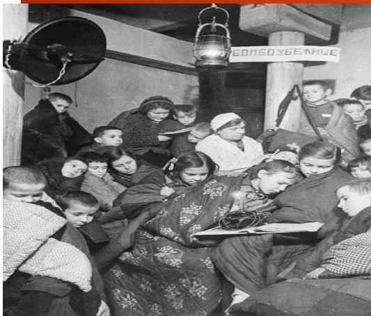
Скрывались от бомбежек