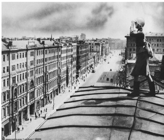
Дежурили на крышах