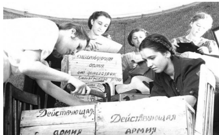
Шили и вязали тёплые вещи