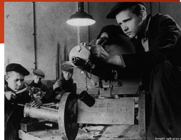
Работали военных заводах