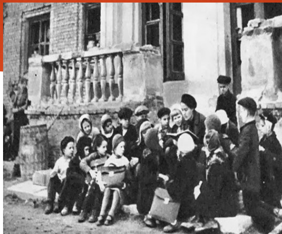
Учились на руинах блокадного города