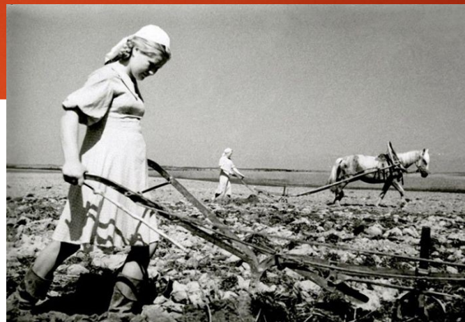
Трудились в поле от зари до зари