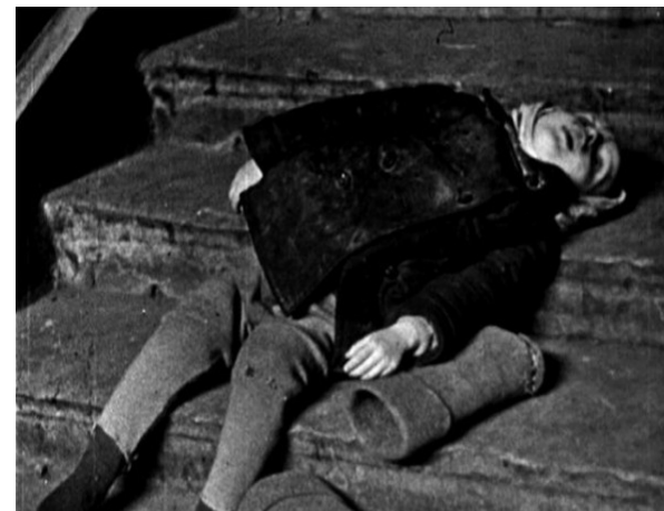
Умирали от голода и холода