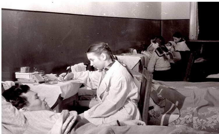
Помогали раненым в госпиталях